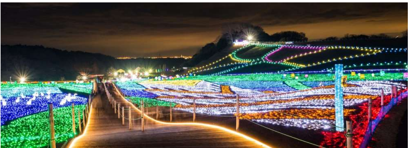
ประดับไฟที่สวยงามที่สุดแห่งหนึ่งของประเทศญี่ปุ่น

จากนั้นนำท่านเดินทางสู่ หมู่บ้านเยอรมันแห่งโตเกียว (Tokyo German Village) ตั้งอยู่ในจังหวัดชิบะ บนอาณาบริเวณขนาดใหญ่ อยู่ห่างจากใจกลางกรุงโตเกียว (Tokyo) ออกไปราว 2 ชั่วโมง ที่หมู่บ้านเยอรมันแห่งโตเกียวนั้นมีทั้งเครื่องเล่นแบบสวนสนุกแต่ไม่หวือหวามาก โซนประสบการณ์ธรรมชาติ เกม กีฬา และโซนสัมผัสชีวิตสัตว์ รวมไปถึงมีกิจกรรม workshop ต่างๆ กิจกรรมเก็บเกี่ยวผลไม้ตามฤดูกาล เป็นสไตล์หมู่บ้านที่จำลองเอาบรรยากาศของท้องทุ่งในเยอรมนี ที่มีทุ่งดอกไม้ไว้ให้ถ่ายรูปเล่น มีอาหารและไวน์ให้ได้เลือกทานกันตามอัธยาศัย ไฮไลท์!!! ที่นี่ถือเป็นจุดชมงาน